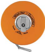
NASTRO INOX - CIFRE SU UN LATO