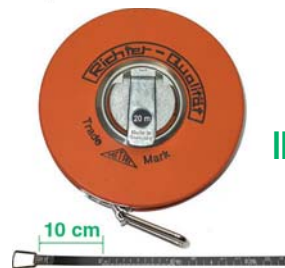
NASTRO INOX - CIFRE SU UN LATO