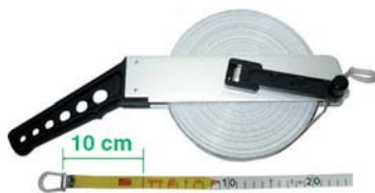
NASTRO FIBRA VETRO - CIFRE SU DUE LATI