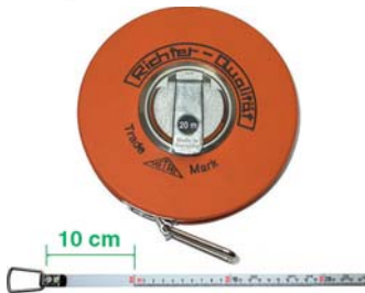
NASTRO SMALTATO BIANCO CIFRE SU UN LATO